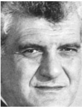
Γιώργος Γιαννόπουλος, Δήμαρχος Ροδίων Yiorgos Giannopoulos, Mayor of Rhodes

Το Φεστιβάλ Οικολογικού Κινηματογράφου στη Ρόδο, τρία χρόνια μετά την πρώτη φιλοξενία του Ecocinema, είναι πλέον ένας εν δυνάμει θεσμός. Και η Ρόδος, κυρίως μέσα από την αποδοχή που έχει αυτός ο εν δυνάμει θεσμός στο κοινό, δείχνει ότι ενδιαφέρεται το 'εν δυνάμει' να γίνει έμπρακτο.