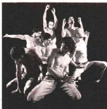
Οι «Los Vivancos» στο «Αθηνών Αρένα»