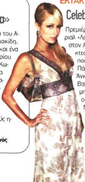
Η Πάρις Χίλτον, μια από τις celebrities που θα κάνουν «πέραςμα» από το «Λας Βέγκας»

Πρεμιέρα του 2ου κύκλου του ξένου σιριαλ «Λας Βέγκας» τη Δευτέρα στις 23.00 στον ANΤ1. Στη σειρά θα κάνουν έκτακτες εμφανίσεις διάσημοι ηθοποιοί και pop star όπως ο Άλεκ Μπάλντουιν, η Πάρις Χίλτον, ο Ντένις Χόπερ, ο Πολ Άνκα, η Μίμι Ρότζερς, ο Ζαν Κλοντ Βαν Νταμ, ο Σιλβέστερ Σταλόνε, ο Ρόμπερτ Βάγκνερ, ο Τζον Μπον Τζόβι, ο Λιλ Ρίτσαρντ, ο Σνουπ Ντογκ, οι Ντουράν Ντουράν, ο Χιου Χέφνερ, οι Πούσικατ Ντολς, η Γκλάντις Νάιτ και ο Τζον Λέτζεντ.