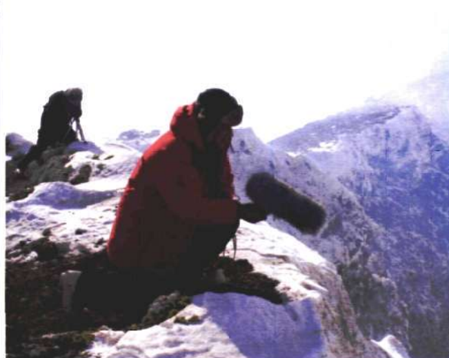
Encounters at the End of the World