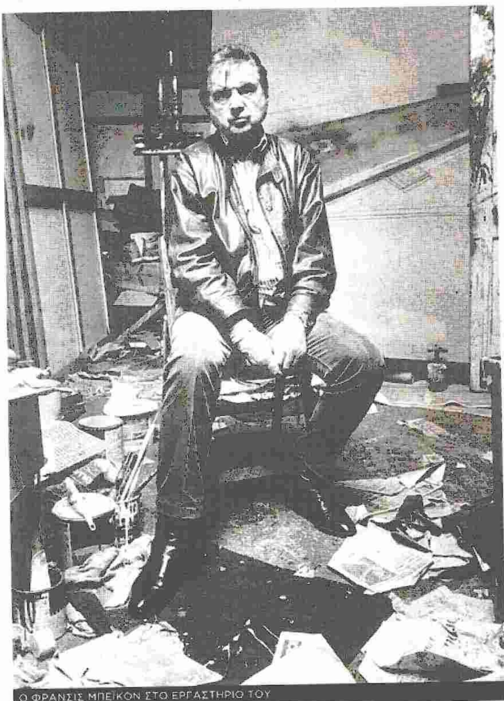
Ο ΦΡΑΝΣΙΣ ΜΠΕΙΚΟΝ ΣΤΟ ΕΡΓΑΣΤΗΡΙΟ ΤΟΥ