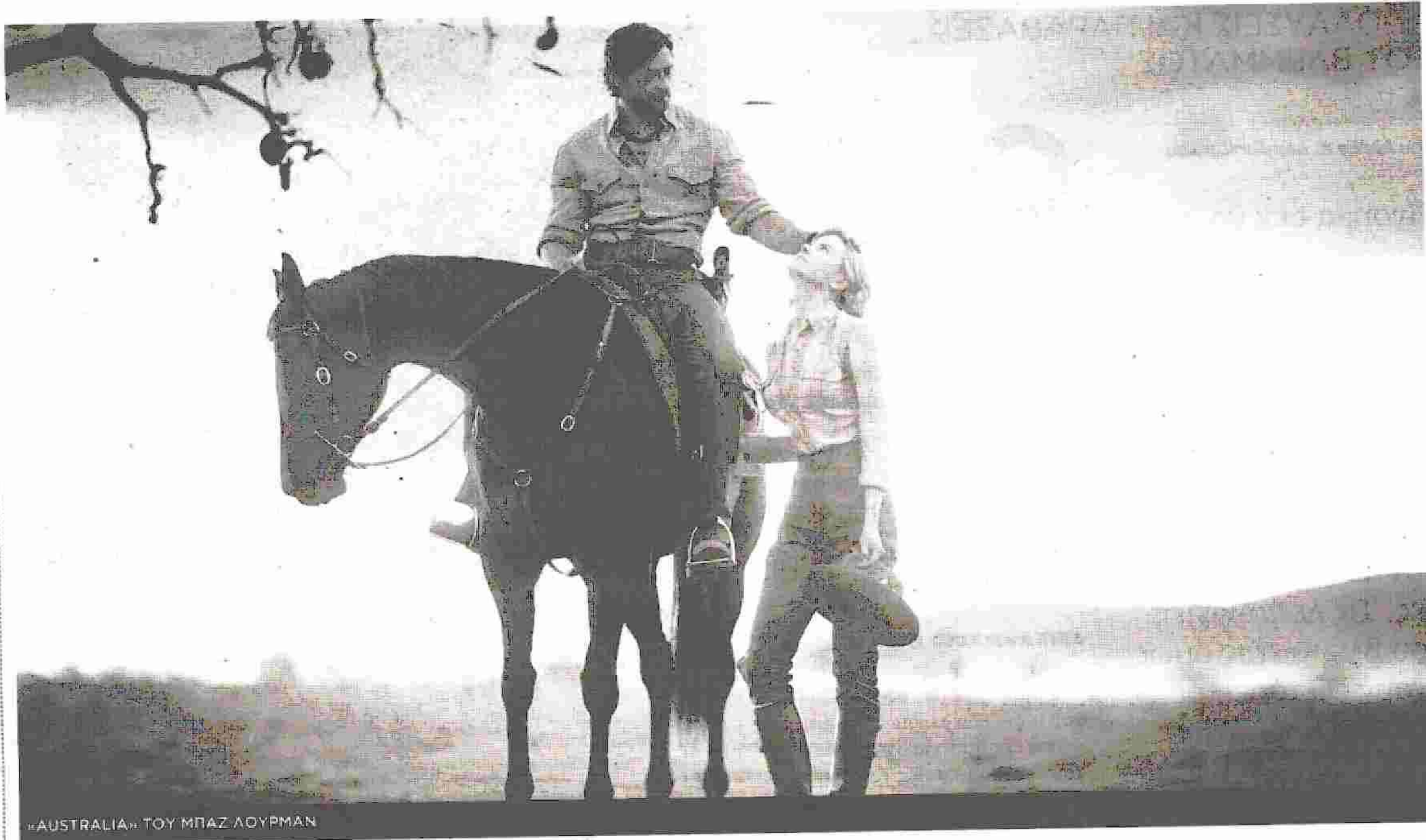
"AUSTRALIA" ΤΟΥ ΜΠΑΖ ΛΟΥΡΜΑΝ

Σε μια κινηματογραφική ταινία εναποθέτουν τις ελπίδες τους οι Αυστραλοί, προκειμένου να ξεπεραστεί η κρίση που διέρχεται ο τουρισμός τους. Αισιοδοξούν ότι το νέο φιλμ του συμπατριώτη τους Μπαζ Λούρμαν θα λειτουργήσει ως τονωτική ένεση, όπως συνέβη προ εικοσαετίας με τον "Κροκοδειλάκια". Η επική ταινία του Λούρμαν "Australia" είναι ήδη έτοιμη και έχει γυριστεί σε πανέμορφες περιοχές της άγνωστης Αυστραλίας. Ο σκηνοθέτης του "Μουλέν Ρουζ" συνεργάζεται και πάλι με τη συμπατριώτισσά του Νικόλ Κίντμαν, ενώ στο πρωταγωνιστικό καστ βρίσκεται και ο επίσης Αυστραλός Χιου Τζάκμαν. "Το φιλμ αυτό θα κάνει για τον τουρισμό ό,τι έκανε και η ταινία "Κροκοδειλάκιας" το 1986, που αύξησε κατά 20% τις αφίξεις" δήλωσε ο επικεφαλής του Οργανισμού Τουρισμού. Η ταινία, η οποία τοποθετείται χρονικά στις παραμονές του Β' παγκοσμίου πολέμου, θα βγει στις αίθουσες τον Νοέμβριο.