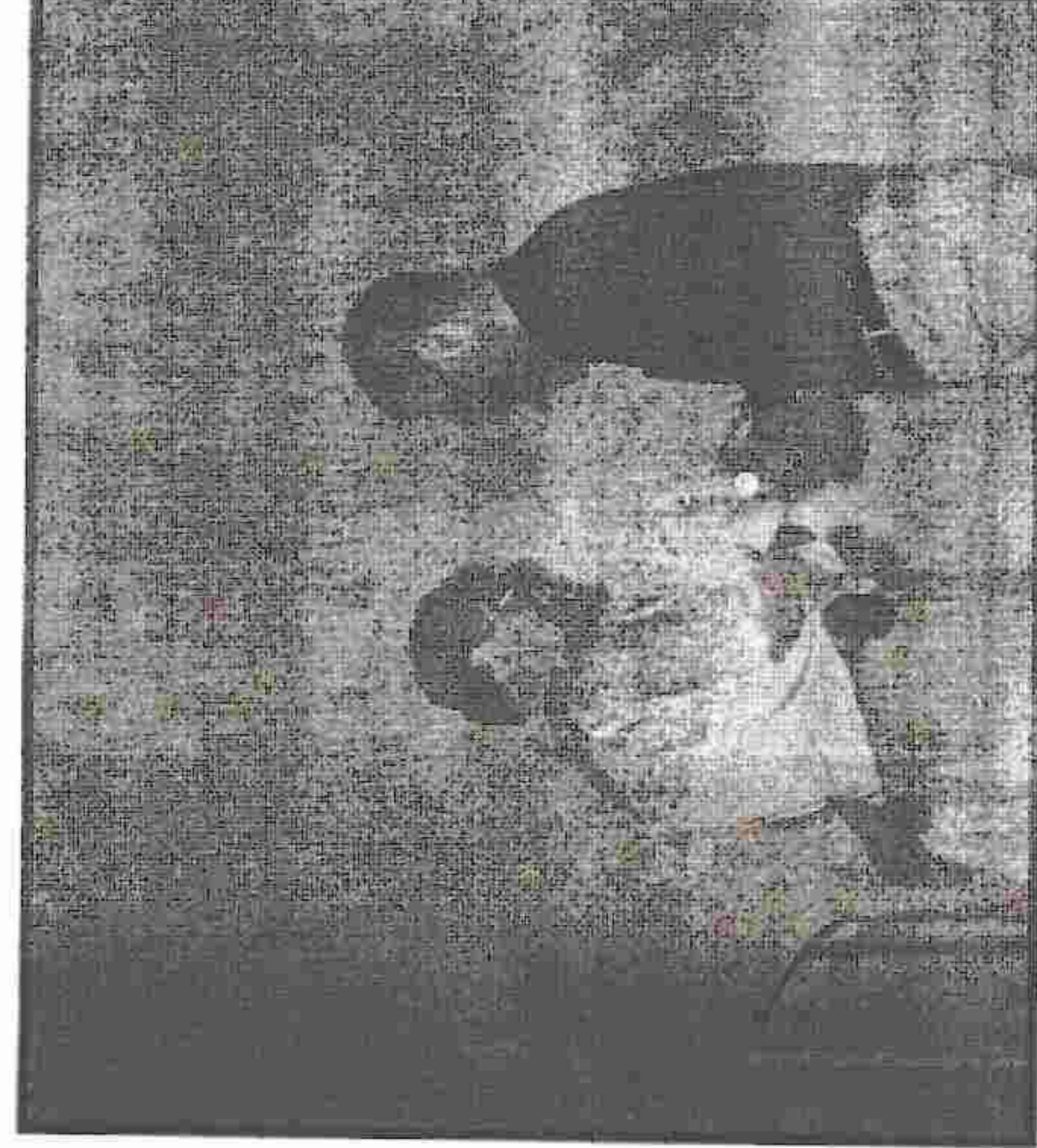
Ειδική μνεία γίνεται στην ταινία «Μαύρος Ποταμός» του Σουρέντρα Μάναν (Ινδία). Η ταινία αποκαλύπτει πως η θρησκευτική πίστη και ενέργεια μπορεί να μετασυσταθεί σε δράση για τη σωτηρία των φυσικών πηγών ενέργειας που είναι ζωτικής σημασίας. Ο Σουρέντρα Μάναν τόνισε ότι το βραβείο αυτό είναι τιμή για την ταινία του, αλλά κυρίως τιμή και αναγνώριση για τις αξίες που αυτή αντιπροσωπεύει.

Το Β Βραβείο της κατηγορίας απονέμεται στην ταινία «Πυρηνική Επινόδος» του Τζάστιν Πέμπερτον (Νέα Ζηλανδία), ο οποίος με διαύγεια και ψυχραιμία, μας δίνει την ευκαιρία να σκεφτούμε ένα πολύπλοκο και αντιφατικό ζήτημα. Η ταινία θέτει σε αντιπαράθεση από τη μια μεριά την επαναφορά της ατομικής ενέργειας, η οποία τώρα προτείνεται από την ατομική βιομηχανία σαν λύση για το φαινόμενο του θερμοκηπίου. Από την άλλη, το κόστος και τους κινδύνους αυτής της τεχνολογίας που τα απόβλητά της θα χρειαστούν 100.000 χρόνια για να αφομοιωθούν από το περιβάλλον. Ο Τζάστιν Πέμπερτον παραλαμβάνοντας το βραβείο του, δήλωσε ότι είναι ιδιαίτερη τιμή και χαρά γι' αυτόν που βραβεύεται «από το πιο ειδηλιακό φεστιβάλ στον κόσμο».